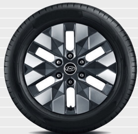
Amplia / Vertex® 235/55 R18