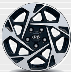
Origo® / Amplia® 205/55 R16