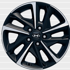
Vertex® 225/45 R17