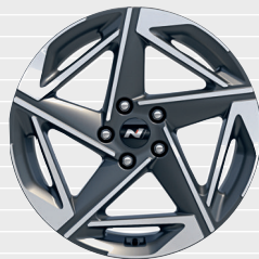
N Line 225/40 ZR18