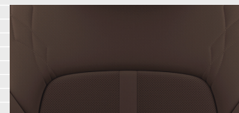
Nappa Leder braun